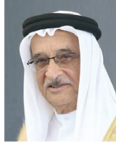
رئيس المجلس الأعلى للصحة

وأكد أن اليوم الأول سوف يشهد العديد من المحاضرات منها السمنة عند الرجال ومستوى هرمون التستوستيرون المنخفض والعلاج اللازم له، إضافة إلى شرح تقنية المساعدة على الإنجاب في مرض السكري، والتأثير العلاجي للصيام المتقطع على السمنة، كما