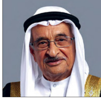
الشيخ محمد بن عبدالله

تنطلق اليوم الخميس، تحت رعاية معالي الفريق طبيب الشيخ محمد بن عبدالله آل خليفة رئيس المجلس الأعلى للصحة، فعاليات مؤتمر الطب الباطني والسكري والسمنة «الأيبدو»، في نسخته الخامسة، الذي يستمر لثلاثة أيام، عن بُعد، بتنظيم شركة إديوكيشن بلاس. وأعرب الدكتور محمد سلمان رئيس اللجنة المنظمة العليا للمؤتمر، عن شكره وتقديره، باسمه واسم أعضاء اللجنة والمتحدثين في المؤتمر، إلى معالي الفريق طبيب الشيخ محمد بن عبدالله آل خليفة رئيس المجلس الأعلى للصحة على رعاية معاليه للمؤتمر، مؤكداً أن رعاية معاليه لها الأثر الإيجابي في تحقيق النجاح للمؤتمر في السنوات الماضية، متمنياً أن يواصل المؤتمر نجاحه في هذه النسخة.