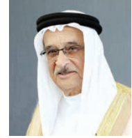
○ رئيس الأعلى للصحة.

تحت رعاية الفريق طبيب الشيخ محمد بن عبدالله آل خليفة رئيس المجلس الأعلى للصحة تنطلق اليوم الخميس فعاليات مؤتمر الطب الباطني والسكري والسمنة «الأيديو»، الذي سيقام خلال الفترة 17-19 فبراير 2022 في نسخته الخامسة، عبر منصة «Zoom» بتنظيم شركة إديوكيشن بلاس. وأعرب الدكتور محمد سلمان رئيس اللجنة المنظمة