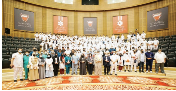
○ وزيرة الصحة مع المكرمين.